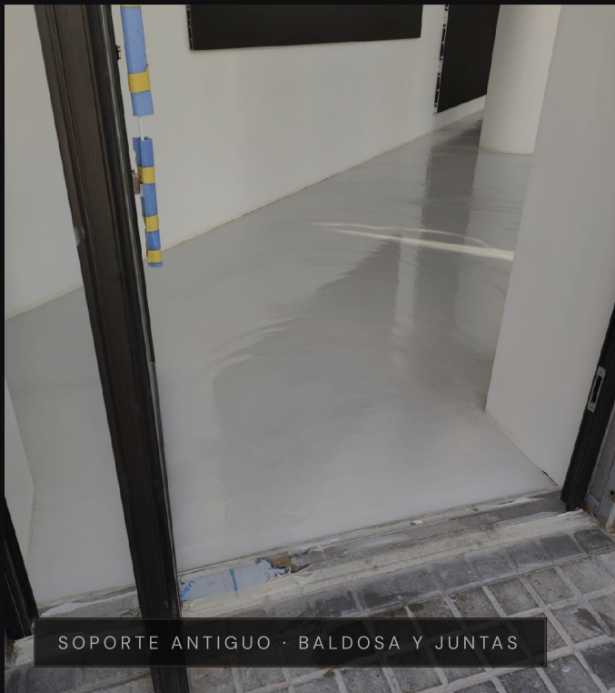
SOPORTE ANTIGUO · BALDOSA Y JUNTAS

Los suelos de hormigón industrial son porosos, sueltan polvo, se manchan con grasas y productos químicos y se desgastan con el tránsito. Y en un comercio o un local de diseño, un pavimento gris, agrietado o con juntas rotas arruina la imagen por mucho que cuides el resto del espacio.